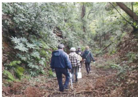
▲昨年11月の歴史の散歩道歩こう会から